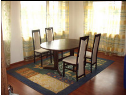
Moderne Einrichtung: Das Esszimmer