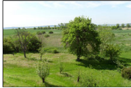
Blick vom Haus auf den Jasmunder Bodden

Wir sind der ideale Ausgangspunkt, zum erkunden der ganzen Insel.