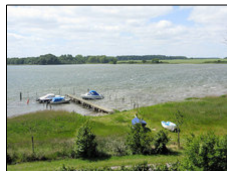
Blick vom Garten

Im äußersten Nord-Osten Schleswig-Holsteins liegt die Landschaft Ostangeln - auch Garten Gottes genannt - zwischen Geltinger Bucht und dem Ostufer der Schlei. Das Ferienland ist eine reizvolle Naturlandschaft eingebettet. Der malerische Fischerort Maasholm liegt in Sichtweite. Hier wird frischer Fisch angelandet. Das nahe gelegene Naturerlebniszentrum bietet interessante Einblicke in die Natur von Schlei und Ostsee. Die direkte Schleilage bietet die Möglichkeit zum Surfen und Segeln.