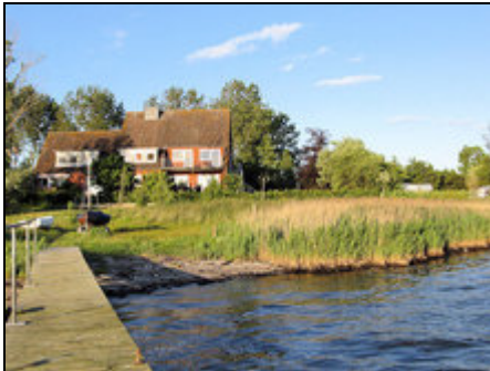
Blick vom Bootsteg