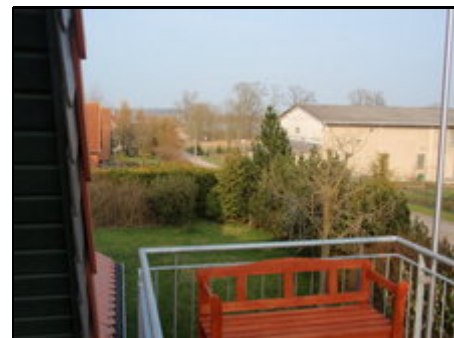
Blick vom Balkon zum Dambecker See

Dambeck ist ein beschauliches Dorf, zentral gelegen zwischen Wismar und Schwerin. Erleben sie hier eine unberührte Natur bei einer Wanderung am Dambecker See, in dem Sie leider nicht baden können. Nach Absprache bieten wir Ihnen auch gerne kleine Töpferkurse an. Per Fahrrad erreichen Sie Ziele in der Nähe aber auch unsere Landeshauptstadt Schwerin.