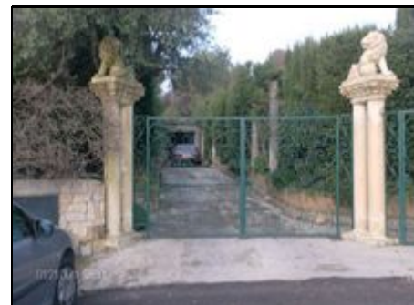
Eingang mit eigenem Parkplatz

Das Haus liegt auf halber Strecke zwischen den schönen Dörfern BIOT und VALBONNE. Es ist in einer Seitenstraße der Hauptstraße gelegen. Das Mittelmeer ist 15 km entfernt(Cannes, Antibes, Juan-les-Pins). Nizza: 25 km. Wohngebiet mit großen Grundstücken. Sehr ruhig! Großer Garten mit einem Pool von 10 x 5 m. Ausführliche Privatsphäre in einem geschlossenen Bereich.Private Terrasse mit Gartenmöbeln.Eingezäunter Garten mit viel Privatsphäre