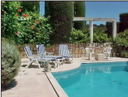
Private Pool & Garden Furniture

In der Nähe des Mittelmeers(Cannes-Bereich): Erdgeschoss-Wohnung für 4 Personen in große Villa mit Pool (10 x 5 m).Großer Garten. Privat Terrasse.