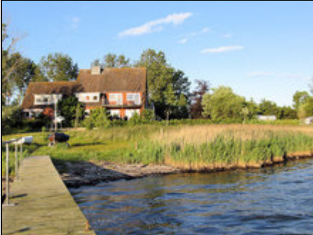
Blick vom Bootssteg