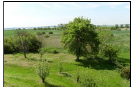
Blick auf den Jasmunder Bodden

Wir sind der ideale Ausgangspunkt, zum erkunden der ganzen Insel.