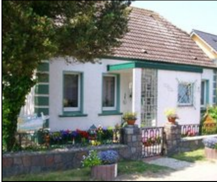
Ferienhaus Fam. Schmidt