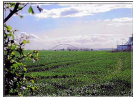
Blick vom Gartentor (Fehmarnsundbrücke)

Der Ort Wulfen im Süden der Insel Fehmarn, ganz in der Nähe vom Wulfener Hals, liegt nur wenige Schritte vom Natur-Badestrand an der schönen Ostsee und vom Golfclub Fehmarn e.V. entfernt. Die Stadt Burg und der Hafen Burgstaaken sind nur ca. 3 km entfernt. Man findet dort herrliche Geschäfte zum Bummeln und Einkaufen und für die nötige Pause auch viele Restaurants.