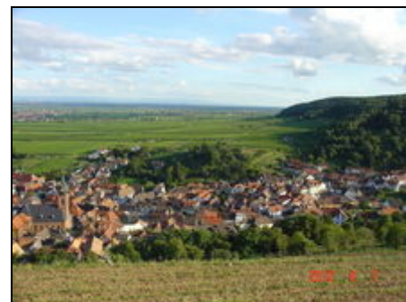
St. Martin mit Haardtgebirge im Westen

St. Martin ist ca. 2 km von Edenkoben (Autobahnabfahrt) entfernt und liegt zwischen Neustadt + Landau.