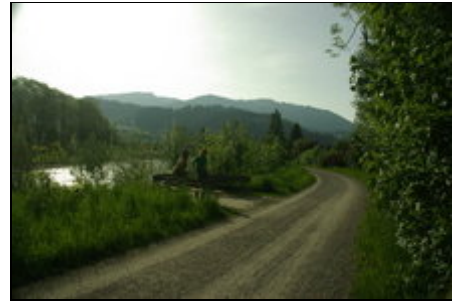
die Iller nur 100 m vom Haus