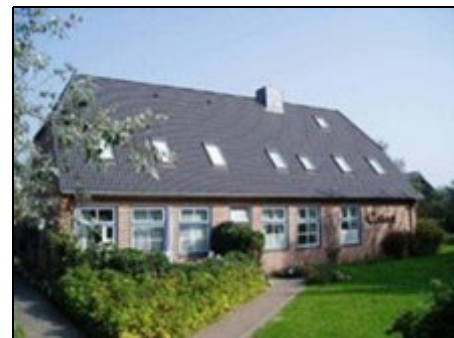
Das "Cottage" Nebel

"Die Perle der Nordsee" besteht aus 20,5 Quadratkilometern Strand, Dünen, Wald und Heide. Erleben Sie einen der breitesten Sandstrände Europas, schöne Dünenlandschaften und nette Friesendörfer. 5 Dörfer können Sie auf den herrlichen Rad- und Wanderwegen erkunden: Wittdün (Fähranleger), Steenodde (frische Krabben direkt vom Kutter), Süddorf, Nebel & Norddorf (Vogelschutzzone "Odde"). Besuchen Sie den größten Leuchtturm an Deutschlands Nordseeküste oder das Heimatmuseum in der Amrumer Windmühle.