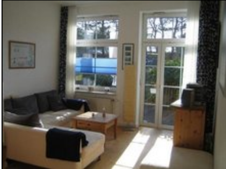
helles Wohnzimmer mit Terrassen-Tür

Inselurlaub von seiner schönsten Seite! Gemütliche helle und preiswerte 63 qm Ferienwohnung direkt am Wattenmeer mit großer Terrasse. Bis 6 Personen.