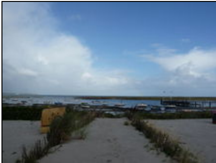
Die Ostsee in Laboe