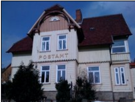
Straßenansicht "Altes Postamt" Schierke

Urlaub im historischen Ambiente: im denkmalgeschützten ehemaligen Postamt von Schierke am Brocken in 3 unverwechselbaren individuellen Ferienwohnungen