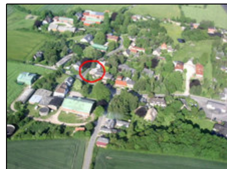
Wippendorf aus der Luft

Besonders schön ist unser hügeliges Angeln im Mai zur goldgelben Rapsblüte (Vorsaison). Im Sommer lockt die freie Ostsee zum Baden an den Sandstrand. Zahlreiche Attraktionen ermöglichen Ihnen ein abwechslungsreiches Programm, in dem für jeden etwas dabei ist: Schifffahrten auf der Schlei und Förde, Nordsee, Phänomenta, Museumseisenbahn, Wildpferde im Naturschutzgebiet "Geltinger Birk", Hochseilgarten im Wald, Wikingermuseum Haithabu, Bummeln und Kultur in Schleswig, Flensburg und Sonderburg DK.