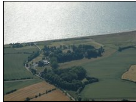
Luftaufnahme Refugium "Pottloch"