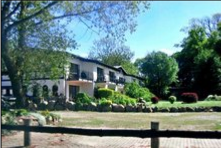
Ferienanlage Gutspark Seeblick