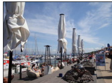
Jagdhafen in Kühlungsborn

Der kleine Ort Kägsdorf liegt malerisch und etwas versteckt zwischen den Ostseebädern Kühlungsborn (2 km) und Rerik (4 km). Der naturbelassene Sandstrand mit guten Bade-, Surf- und Angelmöglichkeiten ist 900 m entfernt. Ein reizvoller Radwanderweg (Europäischer Radwanderweg) führt durch den Ort.