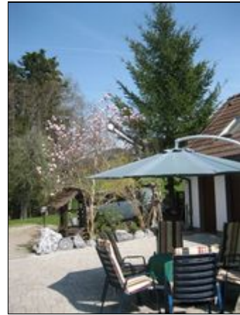
Ein Blick aus dem Fenster

Der Ort Weiler im Allgäu liegt im Dreiländereck Österreich, Schweiz, im idyllischen Tal der Rotach, mit sattgrünen Auen zum Radeln, Laufen, Klettern und Entspannen. Ausflüge in die nähere Umgebung: Lindau /Bodensee, Schloß Neuschwanstein, Sommerrodelbahnen, Berg- und Schmalspurbahnen, sowie verschiedene Bäderlandschaften im Umkreis erwarten Sie. Unsere reizvolle Umgebung bietet für jeden die richtige Abwechslung. WestAllgäu die Rad- & Bikeregion