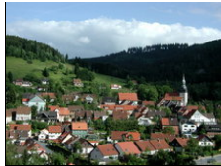
Blick auf Lautenthal

Weltkulturerbestadt Goslar mit Kaiserpfalz und Rammelsberg Bergbaumuseum. Bad Harzburg mit Spielbank und schöner Fußgängerzone. Wernigerode mit Schloß und Eisenbahnfahrt zum Brocken, Bad Grund mit Uhrenmuseum und Tropfsteinhöhle. Torfhaus mit Wanderweg zum Brocken. Sangerhausen mit Rosarium. Stollberg mit Josefskreuz. Hasselfelde mit Westernstadt. Andreasberg mit Sommerrodelbahn. Auch die Rosstrappe und Hexentanzplatz sind gut zu erreichen. Die Sehusa-Therme in Seesen ist ein Besuch wert.