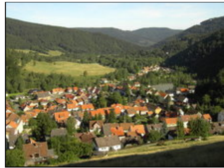
FW. Rose Lautenthal/Harz

Weltkulturerbestadt Goslar mit Kaiserpfalz und Rammelsberg Bergbaumuseum. Bad Harzburg mit Spielbank und schöner Fußgängerzone. Wernigerode mit Schloß und Eisenbahnfahrt zum Brocken, Bad Grund mit Uhrenmuseum und Tropfsteinhöhle. Torfhaus mit Wanderweg zum Brocken. Sangerhausen mit Rosarium. Stollberg mit Josefskreuz. Hasselfelde mit Westernstadt. Andreasberg mit Sommerrodelbahn. Auch die Rosstrappe und Hexentanzplatz sind gut zu erreichen. Die Sehusa-Therme in Seesen ist ein Besuch wert.