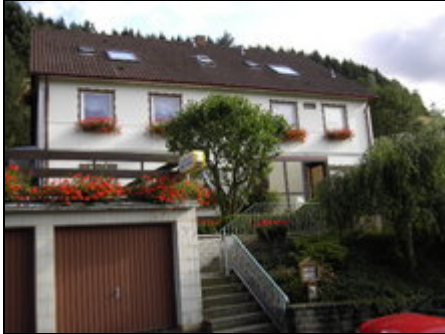
FW. Rose Haus Vorderansicht

Unsere helle und gemütliche DTV 4 Sterne Ferienwohnung Rose liegt ruhig gelegen am Ortsrand von Lautenthal. VERMIETUNG NUR AB 5 ÜBERNACHTUNGEN.