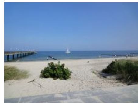
Strand an der Seebrücke in Heiligendamm

Sehenswert: Rostock, die Perle der Ostsee (super Shoppingmeile) und Warnemünde, Seebad, Fischerei-, Fähr- und Yachthafen sowie Wertstandort; Wismar (einstige Hansestadt 13.-15. Jh.); Moorbad Doberan mit Münster (13. Jh.); Besondere Attraktion: Fahrt mit der "Molli" Schmalspurbahn (Bhf. Heiligendamm in 5 Min. zu Fuß erreichbar); Gespensterwald (Steilküstenwald bei Seebad Nienhagen) Unbedingt besuchen: Kühlungsborn, größtes Seebad Mecklenburgs; Rerik, altes Seefahrerdorf zwischen Ostsee und Salzhaff