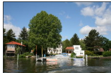
Blick vom See aus

Geführte Tagesfahrten mit unserem Motorboot in die City bis hin zum Berliner Reichstag sind möglich.