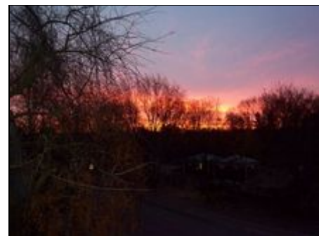
Morgenrot Blick vom Fenster

Einfamilienhaus-Gegend direkt am Rudower Fließ. Gute Einkaufsmöglichkeiten in der Nähe. Kurze Wege zu Bus- und U-Bahn, Flughafen Schönefeld mit Bus in wenigen Minuten erreichbar, zum U-Bahnhof Rudow in wenigen Minuten zu Fuß. (U-Bahn fährt alle 5 Minuten) Mit der U-Bahn 4 Stationen, das größte zusammenhängende Einkaufszentrum Berlins. (Gropius Passagen) Mit Bus oder U-Bahn fahren Sie in alle Richtungen, das Auto bleibt am Haus, somit keine Parkplatzprobleme. Schnelle U-Bahnverbindung zur S-Bahn