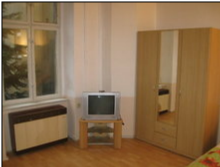
Zimmer Bild 1