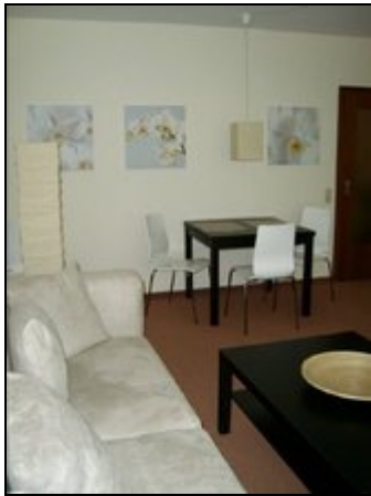
Detailansicht Wohn- und Essbereich