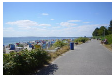
Strandpromenade Richtung Travemünde

Sandstrand und Freizeitpark ganz in der Nähe. Strandpromenade über Haffkrug, Scharbeutz, Timmendorfer Strand bis nach Travemünde, gute Eisenbahnverbindung nach Lübeck und Fehmarn. Schwimmbäder, Radtouren, Besuche von Fisch- u. Schinkenräuchereien, Meeresmuseum auf Fehmarn, Besuch der Hansestadt Lübeck und Erkundungen des Hinterlandes mit Städten wie Neustadt, Eutin, Bad Segeberg, Plön und Travemünde mit seinem Fischereihafen.