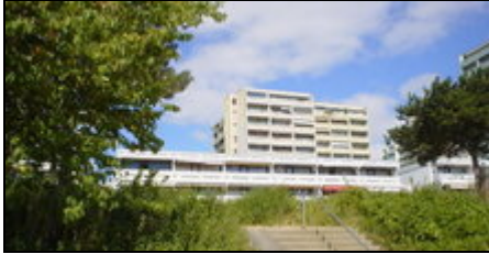
Ansicht von der Seeseite