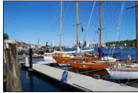
Flensburger Hafen (150m)

Flensburg ist eine Grenzstadt, somit erschließen sich dem Besucher die Attraktionen zweier Kulturen. Der Einfluß und die Spuren von 400 Jahren unter dänischer Krone lassen sich an vielen Stellen finden und prägen Stadtbild und Bevölkerung. Die maritime Vergangenheit läßt sich heute noch auf der Museumswerft und im Museumshafen erleben und nachempfinden. Die gut erhaltenen Fassaden, die engen Gassen der Altstadt und die zahlreichen Kaufmannshöfe laden zu einer Zeitreise in die Vergangenheit ein.