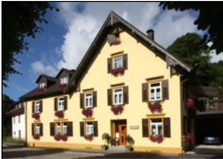
Außenansicht - Süden

Altes Forsthaus Bad Peterstal 4 Sterne Qualitätsgastgeber Wanderbares Deutschland Ferienwohnung 2 60 qm für 2 Personen