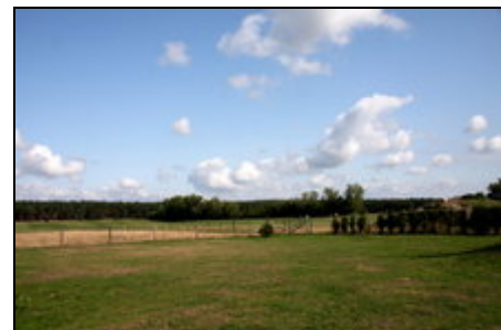
Blick auf Wiesen und Felder

Das Objekt befindet sich im Bundesland Brandenburg, nahe der Stadt Treuenbrietzen, im Ortsteil Pflügkuff, südlich von Berlin und Potsdam. Die Umgebung bietet viele Freizeitmöglichkeiten, z.B. Wandern, Skaten (nahe Fläming-Skate®), Reiten, Schwimmen (ein Freibad ist in ca 3 km Entfernung zu erreichen), Steintherme in Belzig. Auch Burgbesichtigungen, wie zum Beispiel Burg Eisenhardt oder Burg Rabenstein mit Falkner oder die Lutherstadt Wittenberg sind immer einen Ausflug wert.