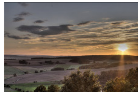
Blick auf Fuldataal

Hist. Altstadt, Dom, Michaelskirche, Schloßpark, Schloß Fasanerie, Museum, Theater, Varieté, urige Kneipen, Wasserkuppe (höchster Berg in Hessen), Segelflug, Motorflug, Drachenfliegen, Kanufahren auf der Fulda. Kreuzberg (das bekannte Kreuzbergbier aus eigener Brauerei), Milseburg (der sehr schöne Milseburgradweg), Point Alpha an der ehemaligen Grenze Zur DDR (Museum, Grenzanlagen, Info), Deutsches Feuerwehrmuseum und vieles mehr. Wir helfen gerne bei der Gestaltung Ihrer Freizeit.