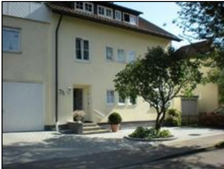
Ansicht des Hauses

Sehr großzügige und gut ausgestattete Ferienwohnung für ein bis fünf Personen am Stadtkern der alten Stauferstadt Schwäbisch Gmünd.