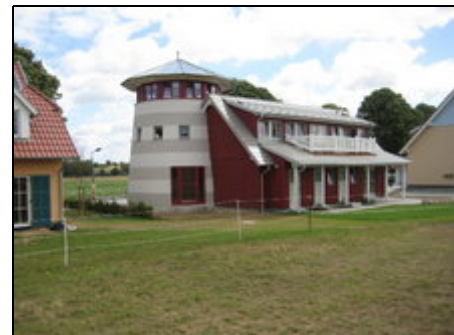
Ein auffälliges Gebäude - Leuchtturm

Wittenbeck liegt direkt zwischen den Ostseebädern Kühlungsborn und Heiligendamm, der weißen Stadt am Meer. Sie haben in unmittelbarer Nähe den Strand, einen 2007 neu eröffneten 18- Loch Golfplatz, den Yachthafen in Kühlungsborn, einen Reiterhof, die Schmalspurbahn "Molli", Geschäfte und Restaurants, Radwege und für Ruhesuchende viele Wanderwege und Felder. Mit dem Auto erreichen Sie in 20 Minuten die Münsterstadt Bad Doberan, Freizeitparks und Museen, Die Insel Rügen und Usedom in ca. 2,5 Std.