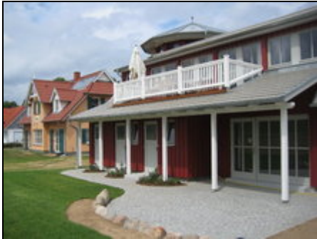
Südseite mit Dachterrasse

Modern u. sehr hochwertig eingerichtete Ferienwohnung für max. 4 Personen mit großem Süd-Balkon und unverb. Blick. Zum Strand 3km. Preis incl Endrein.