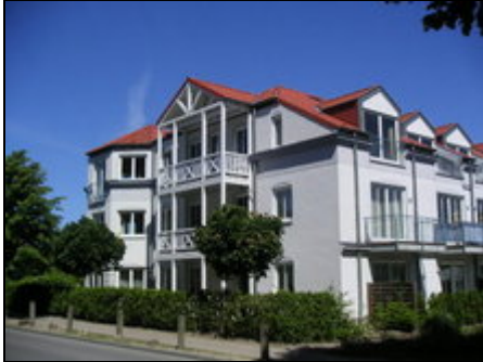
Haus "Am Stadtwald"

Herzlich willkommen im schönen Ostseebad Kühlungsborn! Genießen Sie eine erholsame Zeit und die mecklenburgische Gastfreundschaft.