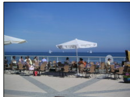
auf der Promenade

Herzlich willkommen im schönen Ostseebad Kühlungsborn. Die einzigartige Landschaft um das romantische Seebad sorgt mit ihren Hügeln, Tälern, Wiesen und Wäldern für ein ausgeglichenes Klima. Das Haus "Am Stadtwald" liegt ca. 700 m vom Strand und ca. 50 m vom Stadtwald (133 ha) entfernt. Einkaufsmöglichkeiten, Restaurants, Cafes, Ärzte und Apotheken befinden sich in der Nähe.