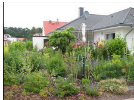
hinterm Wäldchen ist das Meer

Zwischen Heiligendamm und Rügen, als Eingang zum Fischland-Darß, liegt das Seeheilbad Graal-Müritz. Direkt am herrlich breiten, steinfreien Ostseestrand, umgeben von den Wäldern der Rostocker Heide kann man hier wunderbar faulenzen, radeln oder wandern. Anziehungspunkte sind natürlich immer die Seebrücke, die ausgedehnte Promenade und der Rhododendronpark für kürzere Spaziergänge. Für Wellness- und Fitness ist das Freizeitzentrum "Aquadrom" mit Meeresschwimmbecken eine gute Adresse.