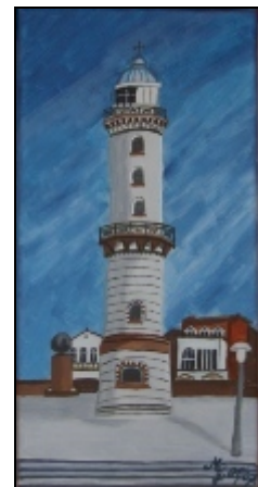
Zeichnung: Leuchtturm von Warnemünde

Ausflüge nach Wismar, Stralsund, Rügen, Güstrow usw. ermöglichen zahlreiche Museum-, Schlösser- und Spassbäderbesuche.