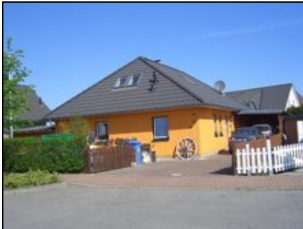
Oberer Bereich = FEWO - Küstenstübchen

Parkentin liegt kurz hinter Bad Doberan. Von hier sind Rostock, Warnemünde, Heiligendamm, Kühlungsborn usw. schnell mit Auto oder Fahrrad zu erreichen