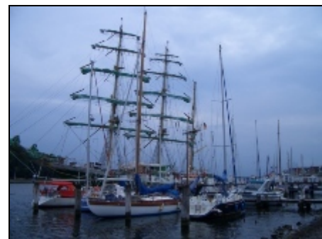
Yachthafen mit der Passat im Hintergrund

In Travemünde können Sie den großen Fährschiffen zusehen, die hautnah an Ihnen vorbeifahren. Erholen Sie sich am Strand oder unternehmen Sie eine Radtour in die attraktive Umgebung. Kinder werden den Hansa-Park oder die Ostseetherme in Scharbeutz lieben. Auch ein Besuch der historischen Altstadt in Lübeck ist immer lohnenswert. Nicht nur die Travemünder Woche, auch weniger bekannte Veranstaltungen wie das Drachenfest, der St.-Lorenz-Markt oder das Lichterfest machen den Charme Travemündes aus.