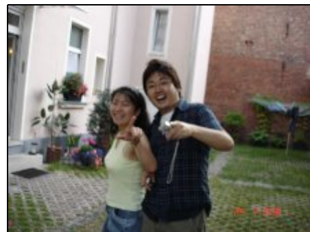
Auch die Japaner haben uns entdeckt!

Der Park ist nur 5 Minuten von unserer Pension entfernt. Das neue Schwimmbad erreichen Sie in 15 Gehminuten maximal oder auch mit dem Bus. Einkaufsmöglichkeiten im nahegelegenen Atrium zu Fuß in 4 Minuten. Irish Pub, Chines und Italiener zu Fuß in 5 Minuten. Spielplatz 300 m Entfernung.