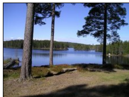
Blick auf den See

Voll- oder Halbpension ist auf Anfrage möglich.