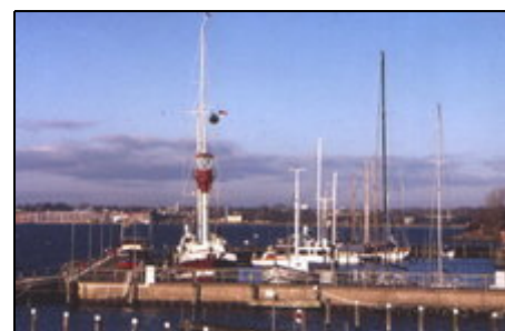
Blick auf den Möltenorter Hafen

Ruhig gelegen am Ortsrand von Altheikendorf. Alle Orte rund um die schöne Kieler Förde, können Sie mit dem Fördedampfer erreichen. Am Möltenorter Fischerei Hafen (OT v. Heikendorf) gibt es täglich frischen Fisch. Der Strand hat feinen weißen Sand und eine DLRG Aufsicht, es wird keine Kurtaxe erhoben. Bis in die Landeshauptstadt sind es 12km nach Laboe 6km.