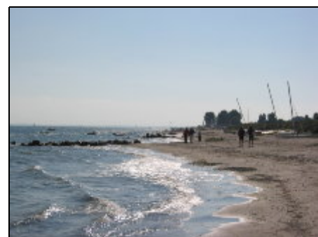
Strand direkt vor dem Garten

Strand: nur 10 m Entfernungen: Autobahn: ca. 4 km Bahnhof: ca. 4 km Bushaltestelle: ca. 0,5 km Einkaufsmöglichkeiten: ca. 3 km Neustadt: ca. 4 km Grömitz: ca. 8 km Hansapark Sierksdorf: ca. 11 km