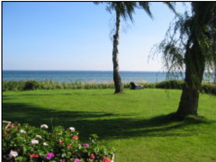
Aussicht von der Terrasse

Die 60 qm große Erdgeschosswohnung liegt zw. Grömitz und Neustadt direkt an der Ostsee und verfügt über einen eigenen Zugang zum kurtaxfreien Strand.