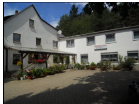
Hofansicht-Mitte FeWo, linkerhand Pension

Entfernung Nürburgring (Start) 12 km; Kloster Maria Laach/Laacher See ca. 15 km, Burg Olbrück, Vulkan-Expreß (Schmalspurbahn), Freizeitbad Kempenich (gleichermaßen für Familien sowie für "Bahnschwimmer" u. Erholungssuchende gut geeignet); Sommerrodelbahn Altenahr, wunderschöne Rotweinwanderwege entlang der Ahr, Tuffsteinmuseum in Weibern (9 km); in der gesamten Umgebung gute Möglichkeiten zum Wandern; im angrenz. Kreis Daun Besichtigung der Maare; Freizeitpark Phantasialand Brühl 45 min PKW