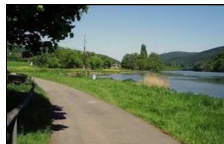
Main, Maintalradweg in Collenberg

Ausflugsziele im Umkreis sind: Miltenberg, Kloster Engelberg, Aschaffenburg, Mespelbrunn, Wertheim, Würzburg, Amorbach, Michelstadt, Heidelberg u. viele andere.