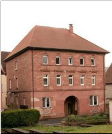
Markantes Sandsteinhaus in Ortsmitte

Neue, sehr gepflegte und modern ausgestattete Ferienwohnung und Gästezimmer in der Ortsmitte von Collenberg, nah am Maintalradweg und Main