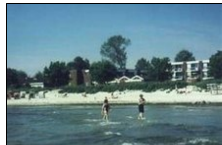
Ostsee, Strandallee 64

Nachbarorte Sierksdorf mit Freizeitpark Hansaland und Scharbeutz mit Ostseetherme, Pönitzer Seenplatte, Timmendorf mit Sea- Life, Niendorfer Ausflughafen und Hemmeldorfer See (Vogelpark), Brodtener Steilküste, Warnstorf (Karlhof), Travemünder Ausflughafen. Lübeck (Holstentor historische Innenstadt -Bummelmeile-). Neustadt mit Hafen. Holsteinische Schweiz (Seenplatte Eutin, Malente - Gremsmühlen, Plön. Insel Fehmarn mit Schifffahrt nach Dänemark oder Bad Segeberg, Kiel, Hamburg haben ihre Reize.