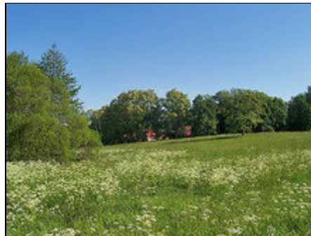
Rückseite, überall Bäume Wiesen

Die nächsten, kulturell wichtigen Städte sind Müncheberg, Frankfurt/O und Fürstenwalde. (Berlin nur ca. 60 km)