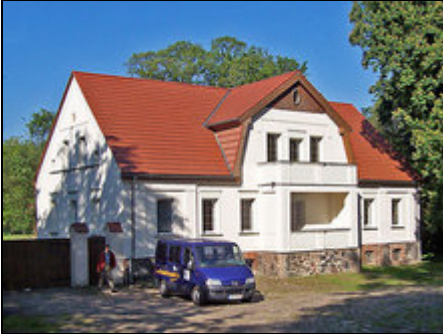
Haupthaus und Vorplatz/Parkplatz

Der Ferienhof liegt in landschaftlich reizvoller, von Seen, Park und Hügellandschaft geprägter Umgebung. Das Haupthaus bietet 2 Fewo (90 u 70 qm).