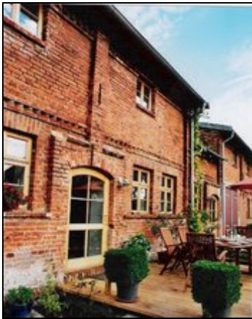
Die großzügige Terrasse

Herzlich Willkommen in unserer großzügigen Ferienwohnung am Ortsrand von Kritzkow!