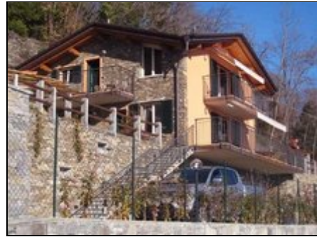
Ihr Ferienhaus Ronc D'Albert

Fähren verbinden Maccagno mit alle Uferorten. Im Ort: kleine Restaurants, ein großes freies Strandbad (neben vielen freien Badebuchten rund um Maccagno) Spazier- und Wanderwege für alle Ansprüche in schier endlosen Kastanien- und Buchenwäldern. Die Schweiz liegt ca.7 km entfernt, Ascona ca.30 km. Auch Luganer und Comer See sind schnell zu erreichen. Ihr Traumziel !