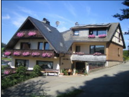
Hausansicht von Südwest

Gemütliche Ferienwohnungen, ruhig, direkt am Wald, dennoch sonnig und zentral, mit herrlichen Panoramablick über Schwalefeld.