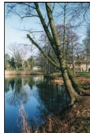
Angrenzende Viktoriapark mit See

Die Stadtvilla befindet sich in einer guten, grünen begehrten Wohngegend in Berlin Pankow, angrenzend am Viktoriapark mit See. Optimale Fahrverbindungen: Bushaltestelle und S-Bahn Wilhelmsruh Fussläufig (ca. 50 und 250 m v. Haus entfernt). Dann ist es nicht mehr so weit vom Potsdamer Platz, Museumsinsel, Regierungsviertel. In 250 m befinden sich die Geschäfte für den täglichen Bedarf: Supermärkte, Bäcker, Fleischer, Kiosk, Drogerie, Bank, Post, Restaurants, Ärzte. Ca. 300 m entfernt: Tierpension