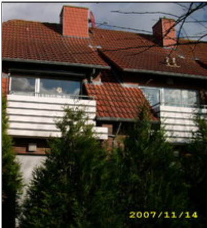
Ferienwohnung mit Blick zum Deich

Norddeich: Fewo (200m zum Strand) mit SW Balkon in zentraler, ruhiger Lage von Norddeich. 05932/4771