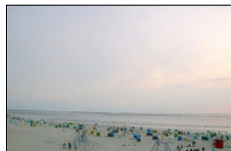
Abendstimmung am Strand

Freizeitgestaltung in Norddeich: Schwimmen in der Nordsee, im Meerwasserbadebecken oder im Wellenbad (mit Sauna). Sonnenbaden am Strand im Strandkorb, Surfen in der Nordsee, Wattwandern nach Juist und Norderney. Gesunde Luft tanken, wohltuend bei Allergien. Viele ausgebaute Fahrradwege am Nordseedeich und im Umland laden ein zum Fahrradfahren. Große und kleine Kinder können Drachen steigen lassen auf dem Deich oder Minigolf spielen. Ein Spielhaus für Kinder mit Animation ist ebenso vorhanden.