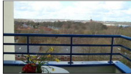
Blick über Flensburg

Die Wohnanlage liegt in einer parkähnlich angelegten Grünanlage in unmittelbarer Nähe der Flensburger Förde. Mit sehr schönen Wanderwegen, teilweise direkt am Wasser. Sehr gute Einkaufsmöglichkeiten (z.B. Aldi ca. 5 Min. Fußweg) Nähe Marineschule. Schöne Badestrände in der Nähe: Solitüde (zu Fuß erreichbar in ca. 25 Min.), Glücksburg/Holnis m.d. Pkw in ca. 10-20 Min. Sehr gute Busverbindungen vom Twedter Plack, (5 Min. Fußweg) zum Zentrum, Förde-Park, Glücksburg, Schloß, Fördeland Therme Gbg. usw..