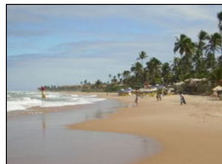
Der Strand vor der Villa Cactus

Im August und September können sie die vorbei ziehenden Wale beobachten.