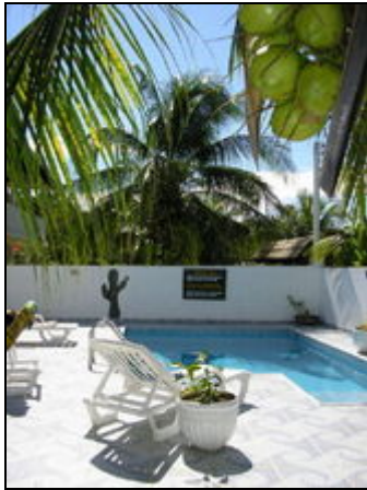
Die Villa Cactus

Ferienwohnungen in einer sicheren Villa am Meer in Salvador da Bahia Brasilien am Strand von Praia do Flamengo. Dem schönsten Strand in Salvador.